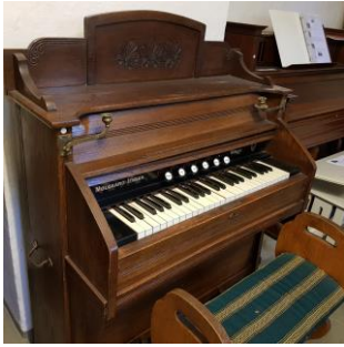
28. Mølgaard-Jensen , Haslev Orgelfabrik. Sugeluft. Spilbart. Placering: KÆLDER A436