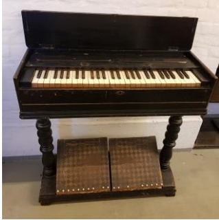
43. Fabrikat ukendt. Søjleharmonium. Ikke spilbart Placering: KÆLDER